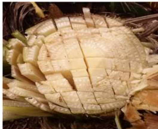
Trampa de Disco modificada (con cuadrículas)